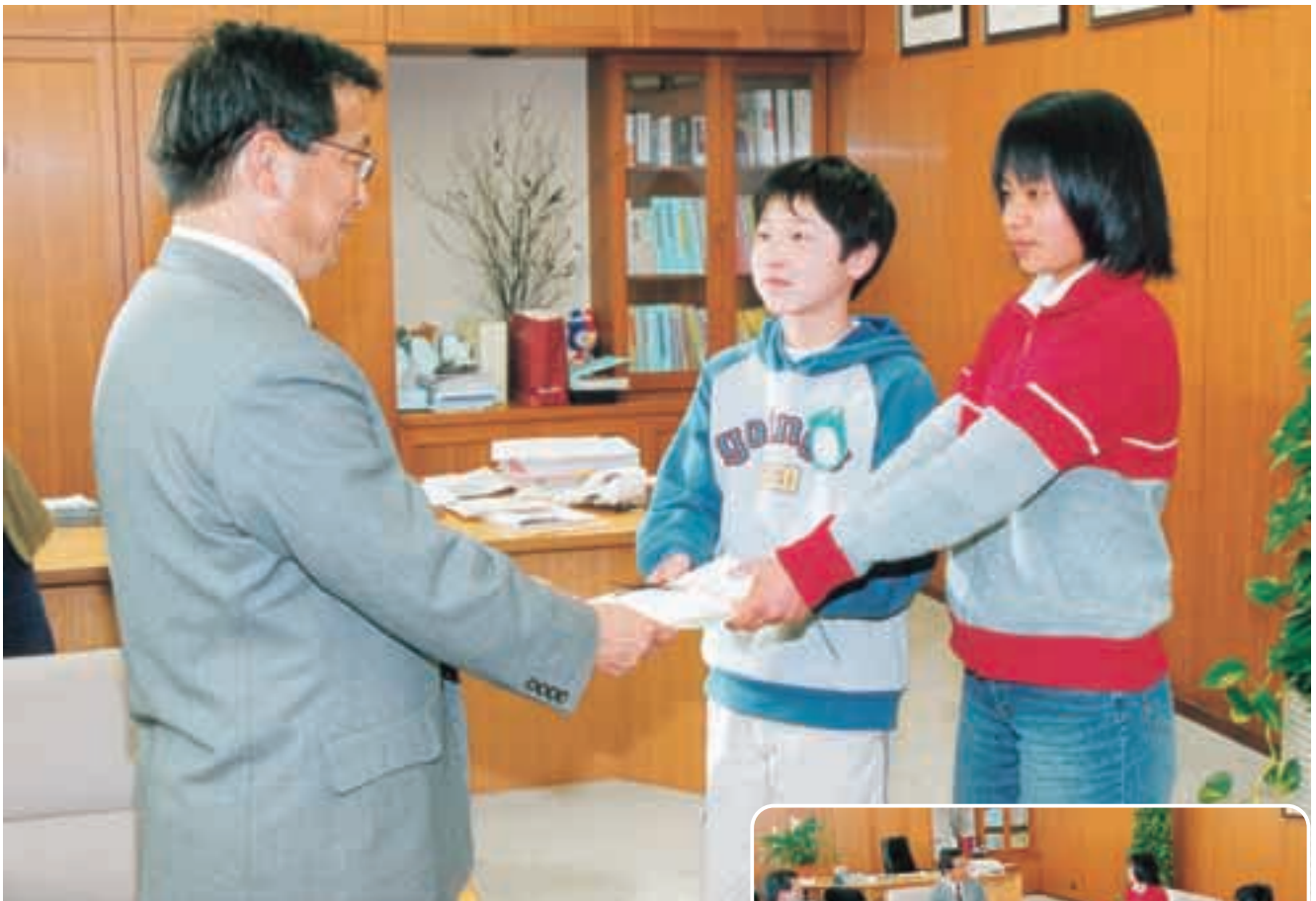
3月8日、高富町立富岡小学校の児童代表者から合併協議会会長に、新市名称の案が提出されました。