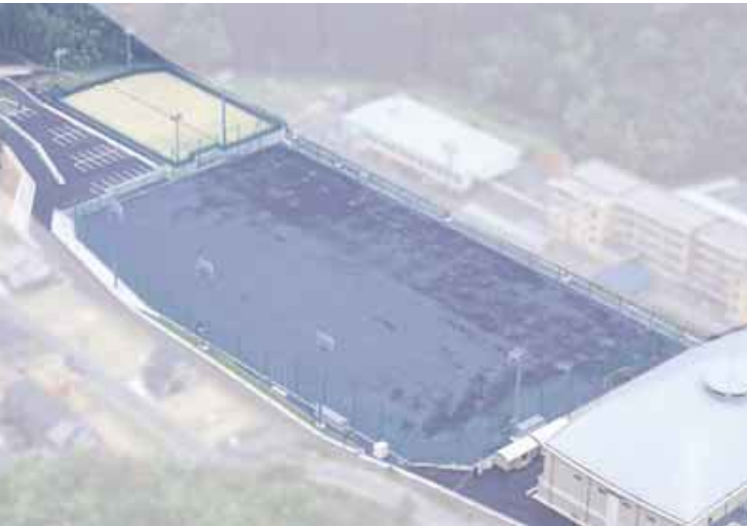
山県市総合運動場(現高富町総合運動場)