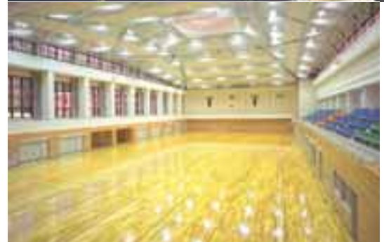
総合体育館アリーナ