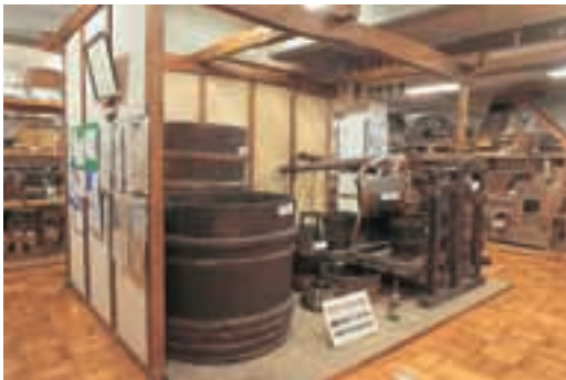
伊自良歴史民俗資料館 農具や生活道具が展示されており、昔の伊自良村の生活を知ることができます。