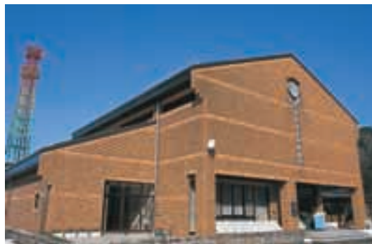
伊自良図書館・伊自良美術館・伊自良歴史民俗資料館 全景 (現伊自良村図書館、美術館、歴史民俗資料館)