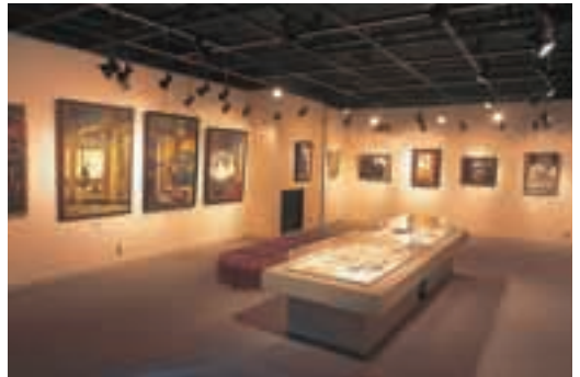
伊自良美術館 伊自良村出身の島戸繁画伯の常設展をはじめ、さまざまな展示が開催されます。