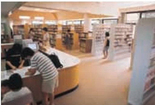
伊自良図書館 利用率は全国トップクラス。蔵書も3町村最大を誇っています。