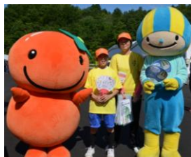
ミナモとナッチョルクンがお出迎え！

市内の書道サークル、自治会、小中学校のみなさんが心をこめて作ったのぼり旗や応援旗を会場に飾り、選手のみなさんにエールを送ります。