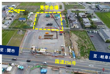
現場状況写真(H29年4月撮影)