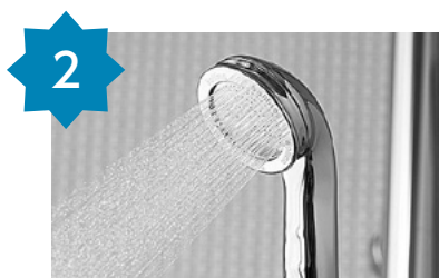
2 ポリーナ ワイド プラス (シルバー)【TK-7008-SL】 申込数 2137件