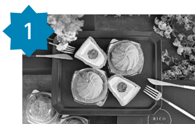
1 生モンブラン 4個入1箱 1個130g 申込数 3927件