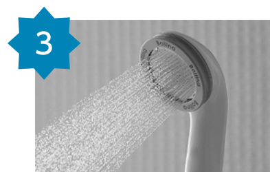
3 ポリーナ ワイド(白) 【TK-7007】 申込数 2061件