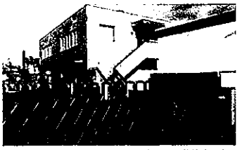
年数が経過し、長寿命化が進行中の高富上水道施設

時となった。その間、市から地域住民に、事故の状況・断水の協力をお願い・復旧の見込みなどの情報提供はなされなかった。破裂した上水道管の復旧工事が完成したのは、同日の夜9時となった。事故は市の指示で漏水復旧工事を業者が行っていたところ、地面掘削により、水道管付近の土圧が減り、水道本管から水が噴き出したとのこと。高富地区は昭和30年代に上水道の敷設が始まり、老朽化が進み、市では漏水調査も行われている。漏水調査とともに、側溝清掃時における住民による止水栓の操作状況情報、消防団の消火栓点検情報も収集し、水道管破裂の予兆を察知することも肝要である。早急な上水道管敷設替え計画の策定と工事の実施を望む。そこで、水道管破裂事故の発生件数は、破裂事故発生時の市の連絡体制は、市民への事故発生の広報は、事故発生時における業者間の連携は、上水道敷設替え計画の策定状況は、漏水調査を受けた敷設替え工事の状況は、について尋ねる。