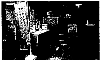
マイナンバーカードの交付窓口(市役所1階)

マイナンバーカードは12桁の個人番号を住民票を有する各個人に付与し、行政を効率化し、国民の利便性を高め、公平で公正な社会を実現する社会基盤として設けられたもの。カードは社会保障、税、災害対策も行政手続きで必要となる。カードに以下の6つのメリットがある。・マイナンバーを証明する書類・各種行政手続きのオンライン申請として利用できる・金融機関における口座開設やパスポートの新規発給での本人確認の身分証明書に利用できる・各種民間のオンライン取引として利用できる・市町村、国が提供する様々なサービスを受けられる・住民票、印鑑登録証明、各種税証明書、戸籍証明書の公的証明書が早朝深夜、土日祝日でも住まいの市町村以外でも最寄りのコンビニで利用できる。全国のマイナンバーカードの普及率は39.7%、2020年7月からマイナポイントとして、カードの取得に対して2万円の利用で最大5千円がもらえることでスタート。現在では国の21年度補正予算により、健康保険を紐づけることで7,500円のポイントが、金融機関での銀行口座に紐づけで7,500円のポイントが付き、合わせて最大で2万円のポイントがもらえる制度になった。そこで①マイナンバーカード普及率は②マイナンバーカード普及向上に向けた市の広報は③既に近隣市で行われているコンビニでの証明書交付となる本市でのシステム導入の検討状況は④マイナンバーカードで提供されるサービスの項目は⑤マイナンバーカードのコンビニ交付で提供されるサービス項目は。