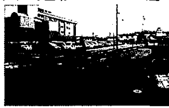
ハンパ設置と30kmゾーン規制を提案する岐北厚生病院周辺道路

河川堤防草刈りについては、台風シーズン前に完了するよう指導する。河川内の倒木処理、住民生活に支障を及ぼす可能性が高いものから処理する。道路の区画線は平成30年度では2月に工事を発注していたが、昨年度から10月発注になったことによる。県管理については、順次、ラインの引き直し努めるとのこと。道路側溝の修繕については随時補修を行う。しゅんせつも必要に応じて行う。ハンパ設置は地元要望もなく、道路構造上問題がないことから設置予定は無い。岐北厚生病院周辺は道路改良工事より、安全に通行出来る道路としていく。