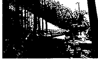
崩落山林の復旧工事が進む現場(円原木戸場)

近年、木材価格の低迷などにより、森林所有者に林業に対する意欲が減少しつつあり、植林した木の間引き、間伐や下草刈りが適正に実施されない森林が目立つ傾向にある。また伐期を迎えたが、伐採されない森林も多い状況にある。県では平成24年度から清流の国ぎふ森林・環境税を創設し、間伐、里山林整備、観光景観林整備などの森林整備、学校での木製品導入事業などの木材利用、環境教育などの普及啓発、水源林の公有地化支援の施策が実施されてきた。その財源は県民から年間一人1,000円を徴収することなどで充当するものである。国においても令和元年度から森林環境譲与税が導入されて来ている。