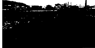
宅地転用が進む中、農地の適正保全を(高富東部)

農地は土地利用において、極めて基本となる基盤である。地下水保全など貴重な水源確保・防災の基本となる貯留機能、食料を提供出来る基盤、生物の育成空間機能、良質な環境を維持する機能など多面的な機能を有する。一方、農業者の高齢化、新たな意欲ある若者などの担い手の減少、国に決定される米価の低減化、農産物への鳥獣被害の拡大、宅地増加による農地転用の増加、耕作放棄地の増加などの新たな課題の発生。高富東部などでの農業機械化営農組合への委託が増大し、宅地への転用も進展している。宅地分譲地からの排水先と農業用水路、排水路との調整、田畑と宅地との境の擁壁の構造形式、市道に接する法面の維持管理(草刈り)の方法、地域共同で行われてきた農業用排水路の維持管理の方法、道路側溝の構造形式など農業者との様々なトラブル発生の要因が増大している。統一した基準を定め、トラブル発生を未然に無くすべきと考える。そこで、農地から宅地に転用された面積規模は、耕作放棄地の面積は、機械化営農組合が農家から委託を受けている面積は、農地の適正な保全を図るため、一定の基準を定めるべきと考えるが、中濃用水管理組合への支援は、農業振興地域以外の農地保全の施策は、について尋ねる。