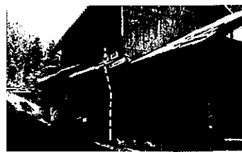
田舎暮らし空家活用補助金を活用した建物(神崎)

◎回答 成果として、平成27年度から30年度まで空き家登録は73件。相談件数は500件以上。空き家の利活用は売買が37件、賃貸が24件、市補助制度で空き家改修が18件。平成30年度までの4年間に46世帯・108人が移住。3世代同居は9件の新築があった。田舎暮らし空家活用補助金の対象区域拡充は見直しを検討する。空き家について不動産業者との連携についても検討する。