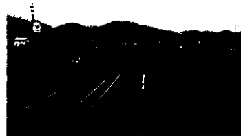
4車線から2車線計画となる国道256号(仮称)高富北バイパス(西深瀬)

◎回答 暫定2車線施工は地元生活者に不都合な形態が長く続くことから、4車線から2車線に減ずる変更とするもの。都市計画の変更は県が行うものである。地域の個別の要望については、現時点では、詳細な個別協議までは行うことが出来ない。