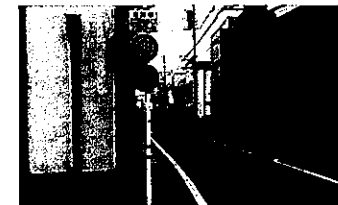
ハンプの設置を提案する30km規制の高富本町通り(高富)

県管理・市管理の道路・河川等の維持管理水準が最近、低下している。草刈りは例年では益までにはほぼ、終了していた。河川内に台風による倒木が存置。道路の区画線は消えたまま、スクールゾーンを示す表示も消えたまま。早急な対応を。本町通りは30km規制にも関わらず、それ以上で車走行。他市で実施している道路上に10cm程度のマウントアップによるハンプの設置を提案する。ハンプにはゴム製の、アスファルトで現場施工するも