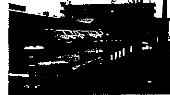
国道256号沿いのバスターミナル等(東深瀬)

◎回答 道の駅の採択基準として、簡易パーキングを整備する、設置間隔として10kmから20kmとされている。交通量として一定の交通量が見込まれることから、国道・都道府県に設置することとされている。富岡はバスターミナルで賑い創出拠点事業を進めている。美山に、ふれあいパザールが、近くにラステン洞戸もある。伊自良には、「てんこもり」がある。以上から、財政状況も踏まえ、インターに近い関本線沿いに設置が考えられる。