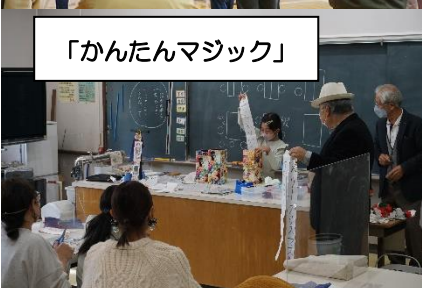
「かんたんマジック」