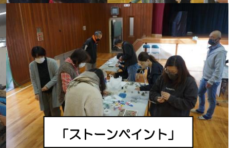
「ストーンペイント」