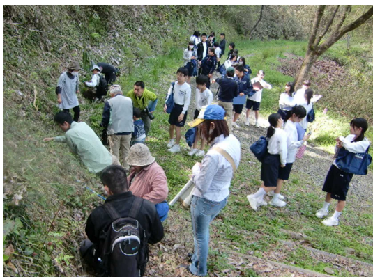
過去の観察会の様子