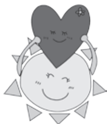
元気君とこちゃん

何年たばこを吸っていても、禁煙するのに遅すぎることはありません。健康介護課では保健師が一人一人に合わせた禁煙をサポートします。また、禁煙外来で医療保険を使用して治療を受けることも一つの手段です。ひとりで悩まず、家族や周りのサポートを受け、禁煙に取り組みましょう。 関健康介護課 TEL.22-6838