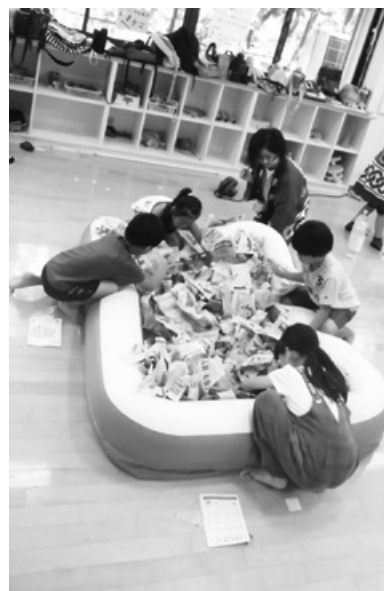
2019年の児童館まつり