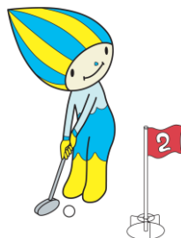
●グラウンド・ゴルフ