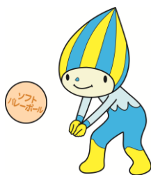
●ソフトバレーボール