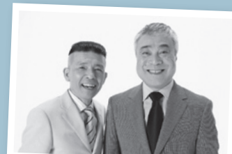
西川のりお・上方よしお