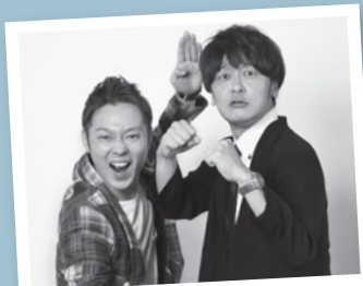
アンダーポイント