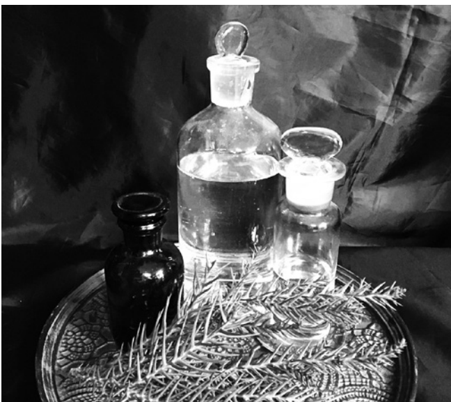
ボトルに入ったフローラルウォーターのイメージ