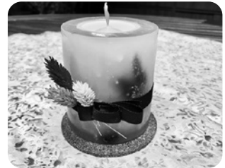
演出用キャンドル