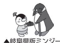
▲岐阜県版ミンジー