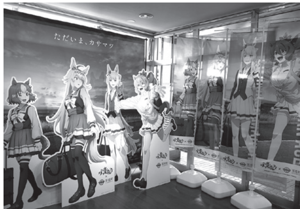
▲コラボイベント展示

アニメ『ウマ娘 シンデレラグレイ』との第2弾コラボレーション企画を開催。オグリキャップを輩出した笠松競馬場がある笠松町を舞台に、作品の世界観を感じられる展示や企画が登場。アニメのモデルとなった風景を巡りながら、トレーナーの皆さんにお楽しみいただける特別なコラボイベントです。詳しくはHPを確認してください。