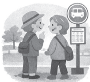
時刻や行き先を確認