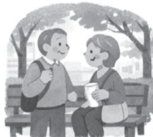
外に出る機会が増える

このような動きが自然に生まれ、足腰の衰えや閉じこもりを防ぐ介護予防になります。元気なうちからバスに慣れておけば、免許返納後も無理なく、安心して外出できます。