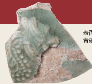
表面採集された 青磁の壺

今回、国史跡に指定された「大桑城跡」は、戦国時代に美濃国守護土岐氏が築いた山城跡と城下からなる遺跡です。令和2年度から6年度にかけて総合調査を実施し、山上の発掘調査では、庭園跡や建物跡、そして多くの遺物を確認するなど、大桑城の構造が明らかになってきました。調査で見えてきた大桑城の姿は、まさに守護にふさわしい拠点というべきものです。本展では、これまで実施した大桑城跡の調査成果を紹介し、発掘調査で出土した貴重な遺物を展示します。また、大桑城跡の南麓に位置する大桑小学校の児童が制作した作品も一部展示します。地域の貴重な歴史遺産であり、国指定の文化財となった大桑城跡を知る機会になれば幸いです。