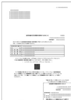
資格情報のお知らせイメージ