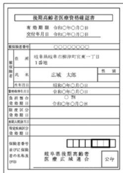
資格確認書イメージ