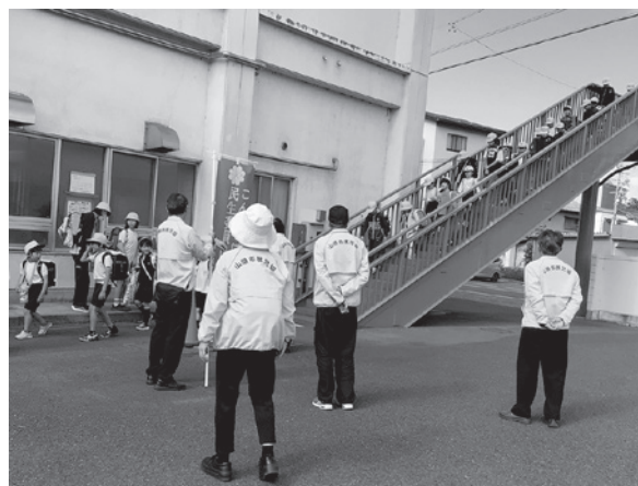
▲高富小学校あいさつ運動