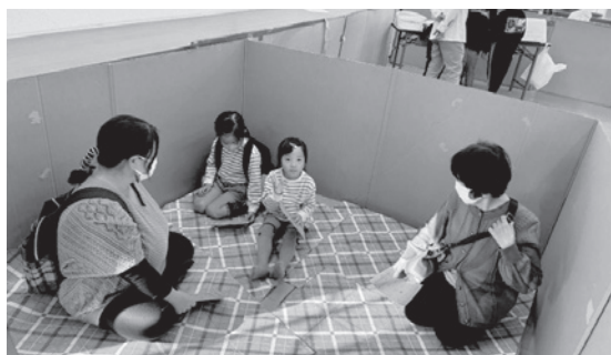
▲昨年度実施した「防災ひろば」の様子