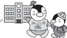
▲岐阜県版ミンジー