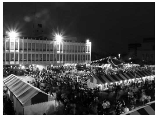
▲昨年度の汽車まつりの様子

日時 8月22日(土)、23日(日) 時間 16時~21時 場所 瑞穂市役所穂積庁舎周辺(瑞穂市別府1288番地)