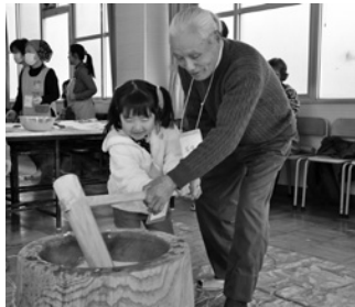
昨年のもちつきの様子