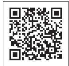
「山県市結婚支援事業」

▼結婚相談所のご案内 セミナー終了後、山県マリッジサポートセンターの相談員が、結婚相談所について説明します。 閩福祉課 Tel 22-6837