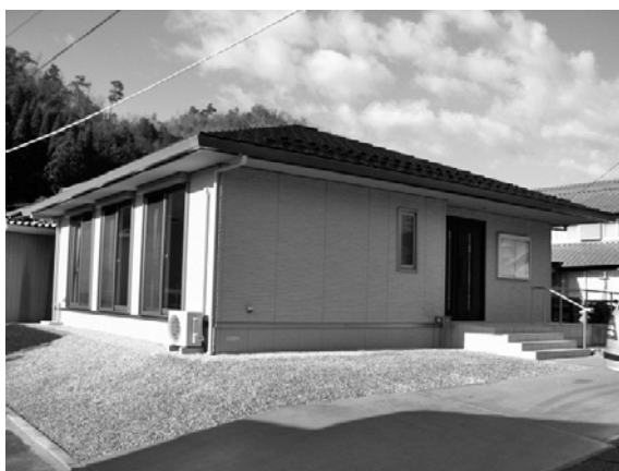
☎企画財政課 TEL 22-6825

「コミュニティ助成事業」とは一般財団法人自治総合センターが宝くじの社会貢献広報事業としてコミュニティ活動や事業に必要な施設・設備に助成する事業です。