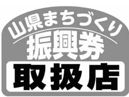
このステッカーが目印です

「山県まちづくり振興券取扱店登録申請書」を提出してください。申請書は、企画財政課や伊自良支所、美山支所、西武芸出張所、商工会にあります。また、市HPからもダウンロードできます。