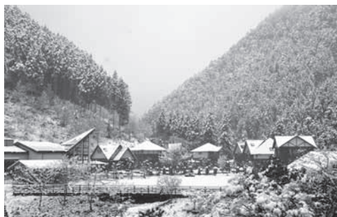
冬は幻想的なイルミネーションや、雪景色を楽しめます