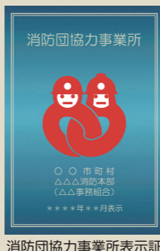
消防団協力事業所表示証

※ 消防団協力事業所表示制度(総務省消防庁ホームページ) http://www.fdma.go.jp/syobodan/welcome/company/index.html