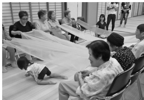
「いこいの広場」との交流会