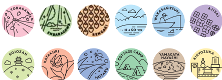
↑ We have POTENTIAL 缶バッジ(全12種類のうちひとつ)