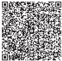
空メール専用QRコード