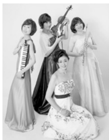
キャトルフィーユ