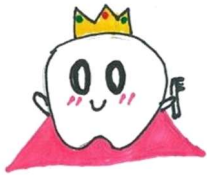
【桜尾小歯みがきキャラクター 歯ピッカちゃん】