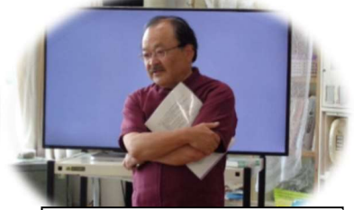
アサヒ歯科医院 TEL 0581 - 22 - 5115