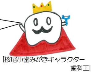
【桜尾小歯みがきキャラクター 歯科王】

新しい1年が始まりました。「自分の健康は自分でつくる！」を合言葉にして、桜尾小の子全員が元気ですごしましょう。