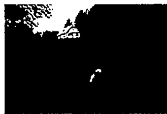
モンキードッグによる追い払い

数も増加する結果となり、令和2年からは個体数調整(駆除)に力を入れ、転換をはかっています。