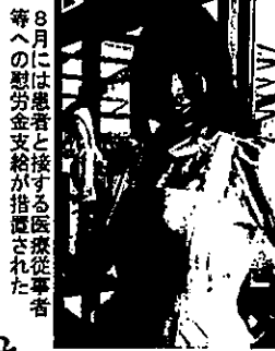
8月には患者と接する医療従事者等への慰労金支給が措置された

コロナ禍で、医科・歯科医療機関は、患者さんと医療従事者の感染防止に最大限の注意を払いながら、日常診療を続けています。政府の2次補正予算では、「新型コロナウイルス感染症緊急包括支援交付金」が拡充され、「患者と接する医療従事者等への慰労金支給」「医療機関等における感染拡大防止等の支援」が