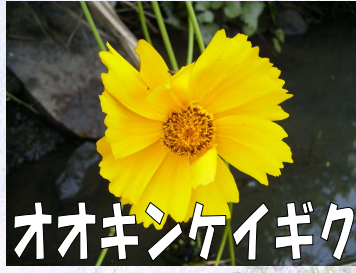
オオキンケイギク