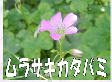
ムラサキカタバミ