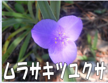
ムラサキツユクサ