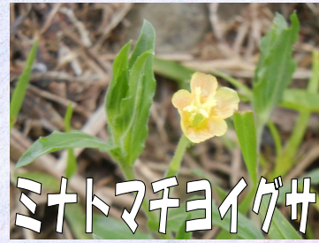
ミナトマチヨイグサ