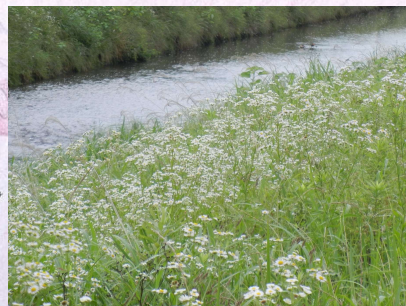
6月のヒメジョオンの白色

「鳥羽川の花」では、堤防の内側に生育している植物を紹介しています。堤防の外側の植物に比べ、内側の植物の方が多種多様ようです。鳥羽川の大量な水の流れが、生物多様性の源になっているのでしょう。 緑の堤防は、3月下旬から4月上旬はセイヨウカラシナ（菜の花）の黄色、5月はクサフジの淡い紫色、6月はヒメジョオンの白色に染まります。