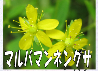
マルバマンネングサ