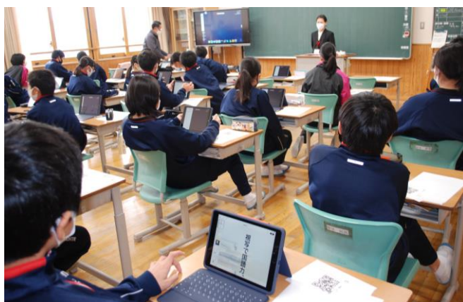
【iPadを活用した授業の様子】

そんな中、12月には全校生徒にiPadが配付されました。先生方も授業において、iPadを使