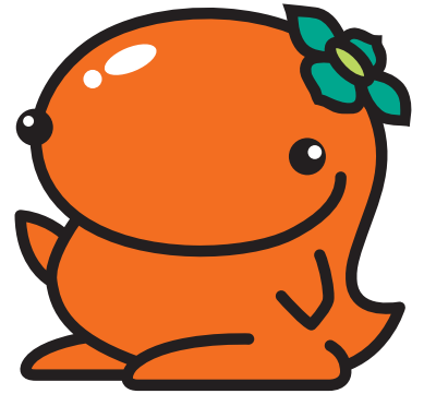
山縣市観光PRマスコットキャラクター「ナッチョルクん」

山縣市では、サントリーグループと協定を締結し、令和6年4月1日より「ボトル to ボトル」を開始します。資源が循環するサステナブルな社会の実現に向けて、ペットボトルの分別にご協力ください。