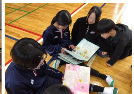
下級生からのメッセージ