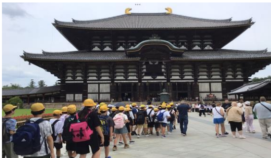
【6年：修学旅行の様子】

のドキドキと期待感のワクワクした気持ちで出発し、49人の5年生は全ての活動を全力でやり切り、笑顔いっぱいの満足感のある2日間を自分たちで創り上げました。活動を支えてくださった方からは、「反応のよさ」「元気に活動するパワー」「積極的に発言できる頼もしさ」のある素晴らしい5年生だと嬉しい言葉をいただきました。5年生49人が「森と川の学校」で得たものを日常生活で発揮し、一人一人の活躍に期待が高まりました。